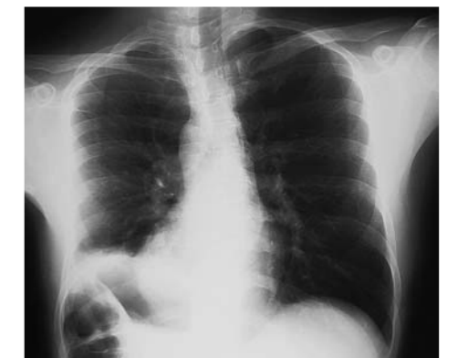
L'imagerie médicale, une aide au dépistage et au diagnostic

Lorsque le cancer est plus évolué, les progrès de l'anesthésie et de la chirurgie font qu'il est désormais possible d'opérer des personnes de plus de 75 ans, parfois beaucoup plus.