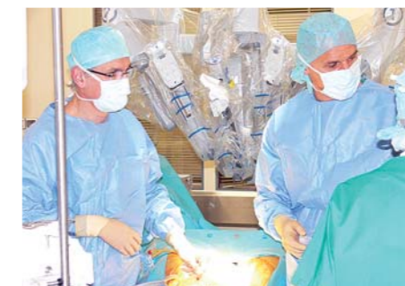
Equipe d'urologie réalisant une ablation de la prostate dans une salle de bloc avec le robot da Vinci Hd Si.

pour la chirurgie gynécologique et digestive. Le progrès pour nos patients est permanent en cancérologie.